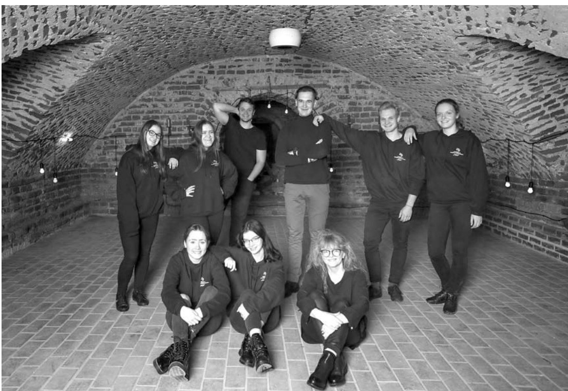
Ši teatro studijos „Mes“ nuotrauka pateko į nacionalinio fotoprojekto „Lietuva ir mes“ albumą.