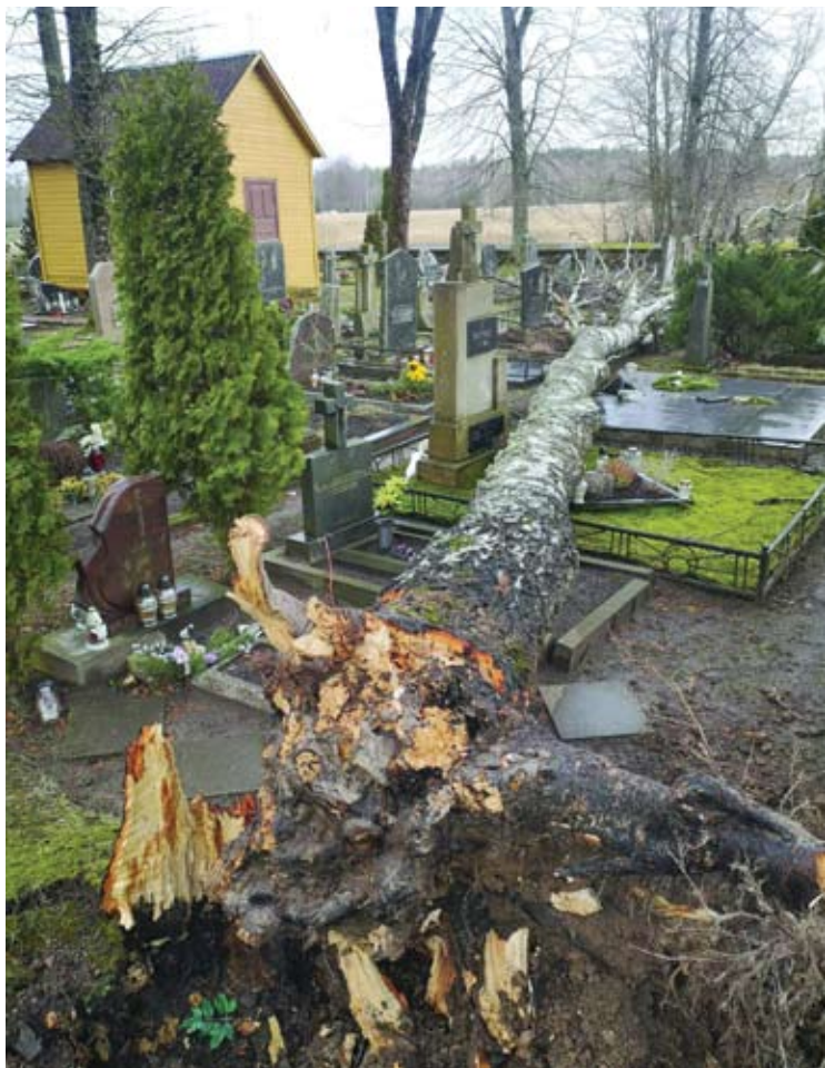
Čekonių (Debeikių sen.) kaimo kapinėse nuvirtęs beržas apgadino kapavietes.