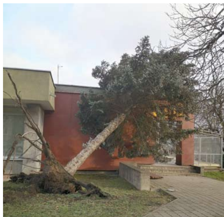
Kavinės „Juna“ stogas praktiškai nenukentėjo - medis ant jo švelniai atsigulė.