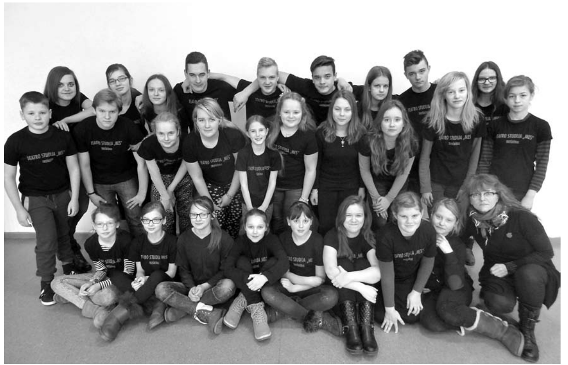
Teatro studija „Mes“ šiuo metu yra vienas ryškiausių vaikų teatrų Lietuvoje.

Taip pat tarptautiniai profesionalios muzikos meno projektai. Ši