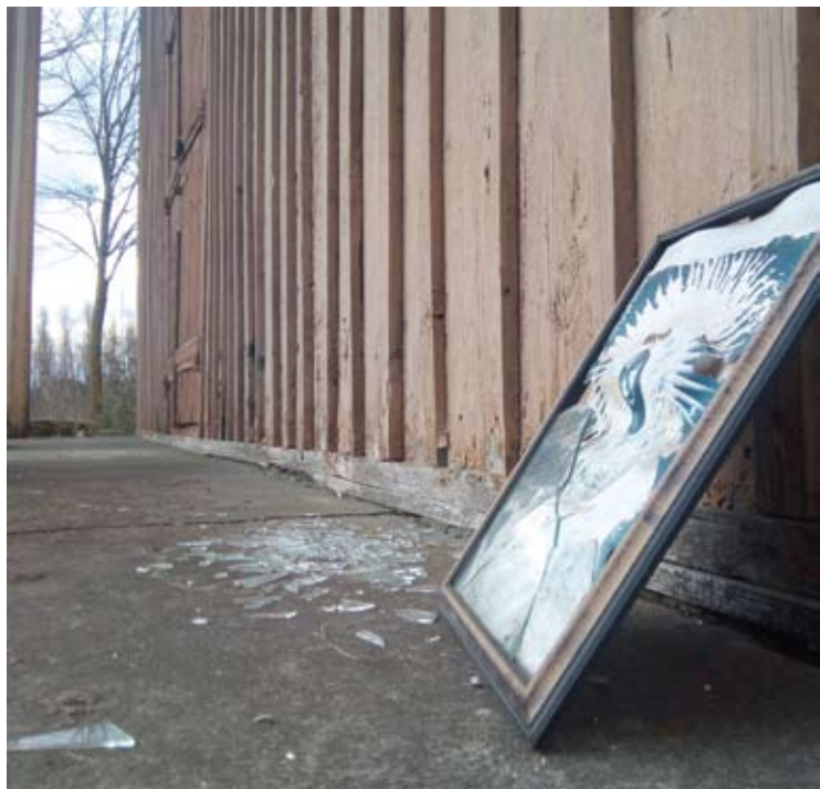
Audros gūsis sudaužė Švč. Mergelės Marijos paveikslą, kabėjusį ant Juostininkų koplyčios sienos.