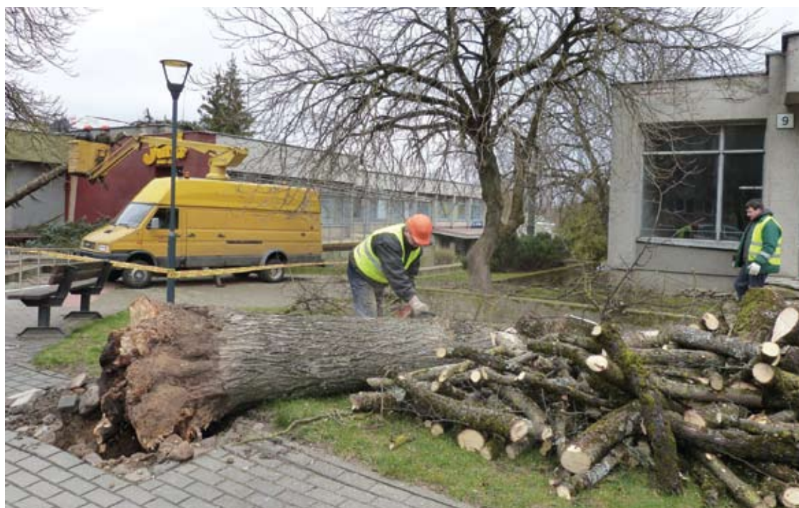
UAB Anykščių komunalinis ūkis darbuotojai nuo penktadienio ryto tvarkė virtuosius.