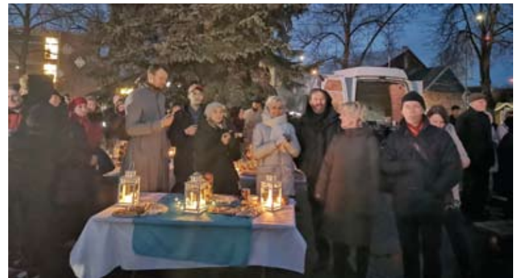
Vakare prie paminklo Laisvei vyko koncertas ir suneštinis.