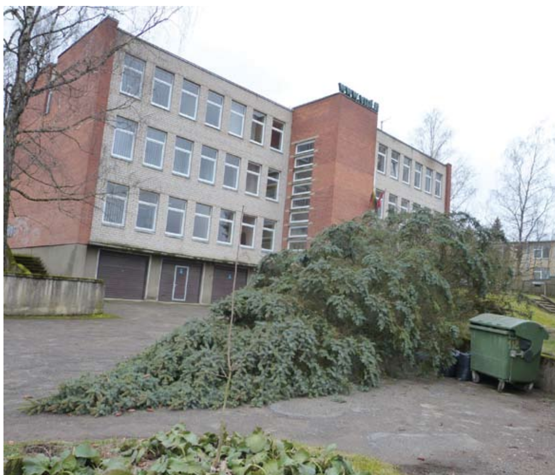
Prie Valstybinės mokesčių inspekcijos Anykščių padalinio pastato virto eglė.